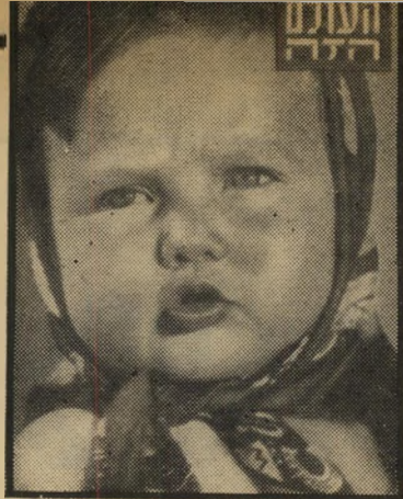
על עיני הילד