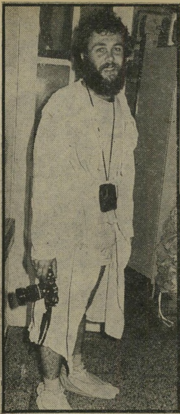
פטר פן ב"הדרסה" אין דו"ח חנייה

אנחנו רק מקווים שמרוב קריאות מעין אלה לא יהליט סתר יום אחד לחתוך לעצי מו את הארון.