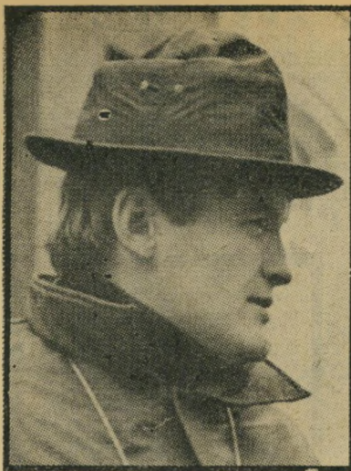
יו"י סקולימובסקי הבטיח יותר משקיים

שני סרטיה-השנה האחרים נעשו בידי במאים ילידי אטליה. זהות נגובה של מיקלאנג'לו אנטוניוני הוכיח, לכל מי שהספיד את כשרונו של במאי