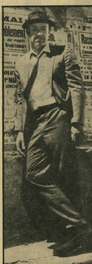
ג'ין הקמן בחזרה מן הסמים