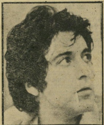
אל פאצינו של בוגרי הסנדק