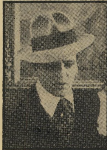
שחקן-מישנה השנה: קלאוס קינסקי "חשיבותה של אהבה"

פיש וסוסים להשכרה אינם דורשים השקעה גדולה, אלא שאף יש לו סיכוי סביר לכסות כמעט את השקעתו ממכירת הכרטיסים בקופה, ולנפח לעצמו את הכיסים בתמיכה הממשלתית, שהיא רווח גקי. הישג אחד, לפחות, חייבים לזקוף לזכות הסרטים הישראליים, הם הצליחו להפיג סופית, בעיני העולם, את הרושם שזוהי מדינה של אנשירוח חרשבים, יש ראל מעורה עתה היטב במרחב, צריך רק להקפיד קצת על הליטוש הטכני, ולא יקשה להגיע לרמת השכנים.