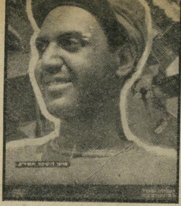
"העולם הזה" 726, התאריך: 27.9.51

גיליון השנה הראשון, שעל שערו התנוססה תמונת "אישה-שנה". ככתבה נאמר: "אישה השנה של תשי"א אינו מדינאי. ראשי המפלגות וחבריהן לא התעלו מעל לקטנות-היום שלהם, לא התגברו על חיכוכיהם הפנימיים, שינאותיהם ההרדויות, למאמן אחד של בניין אישה-שנה של תשי"א אינו סופר, מחזאי או אמן. בין עשר רות הספרים למיניהם, הרוויים סימפוזיאלים, בין מוספר המחזות והיצירות המקוריות, לא בלט דבר מיוחד, לא שגאה כראיה חדשה. אישה-שנה של תשי"א גם אינו תעשיין או פועל, פקיד או נהג. הם רדפו אחר ריווחי השעה שלהם, עסקו בשוק השחור, בהאטת הייצור, בדרישות בלתי-מוסקות להעלאת השכר