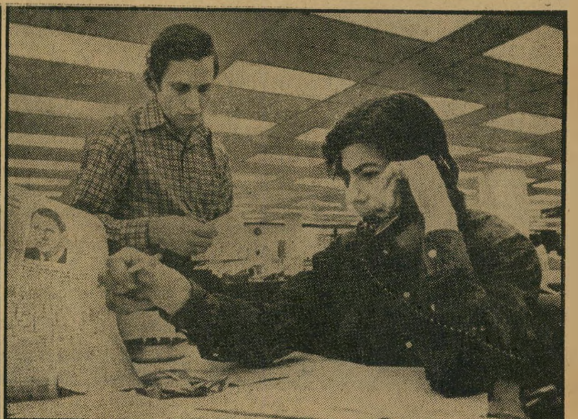
עיתונאים קארל ברנשטיין ובווב וודוורד משמ'צים חסרי-ביס

טון על הפקת הסרט. "גדהמתי מן המיי זוג של הנימוס וחוסר-הסבלנות שבו, לכי אורה, נדמה שהחינוך הטוב שקיבל בבית מאלץ אותו להתייחס בדרך-ארץ לזולת. מצד שני, זה נראה כהצגה, שנועדה להס' תיר את העובדה שמעייגיו במקום אחר, וודוורד, לדעתי, מכור לעבודה שלו, נד' חף קדימה לא רק בשל הצורך לעבוד, אלא גם בשל סקרנות בלתי-נדלית. הוא מדבר אתך, ועיניו תרות אחר מה שמקיף אותו בחדר, כשהמוח רושם מיידית את כל הפרטים. הוא עושה רושם של איש הנע בכבודות, אבל האמת היא שוריותו גדולה עד-כדי הטעיית הסובבים אותו."