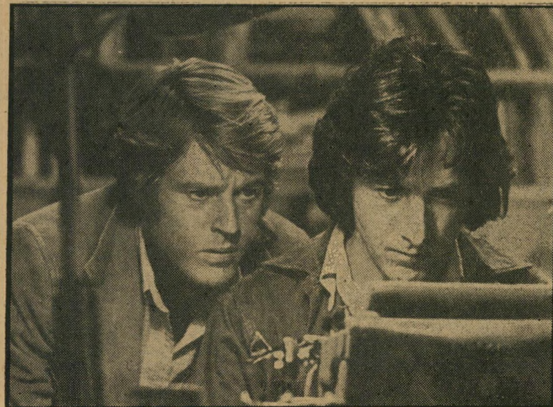
שחקנים דאסטין הופמן ורוברט רדפורד כתבת-חוקר מצויינת

מכור לעבודה שזו. רדפורד והופמן החלו מופיעים שם מדי בוקר בשעה תשע, כאילו היו שוליות-עיתונאים מן המניין, לומדים את האווירה, את המקצוע, נצמד די, כל אחד מהם, לדמויות שהם עומדים לגלם. כשפגשתי לראשונה את וודוורד, סיפר לאחר-מכן רדפורד, במאמר-ענק ש' הופיע בעיתון-הפופ האמריקאי רולינג