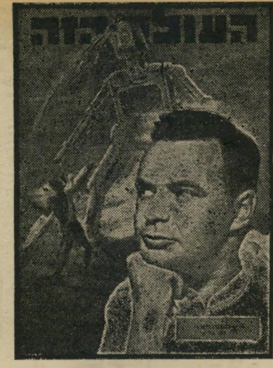
איש השנה תשמ"ז פרקליט תמ"ר