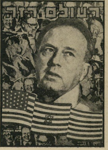
איש השנה תשל"ה ראש ממשלה רבין