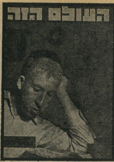
איש השנה תשי"ח חתן תנ"ך חכם