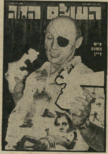
איש השנה תשכ"ז שר הביטחון דיין