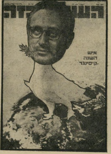
איש השנה תשל"ד מסדר ביניים קיסנינג'ר