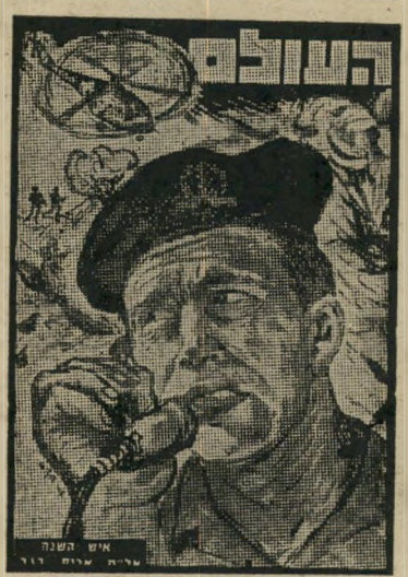
איש השנה תשכ"ח לוחם בפידאיון רגב