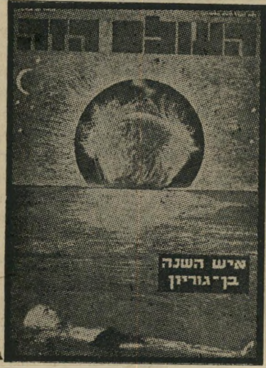
איש השנה בן-גוריון