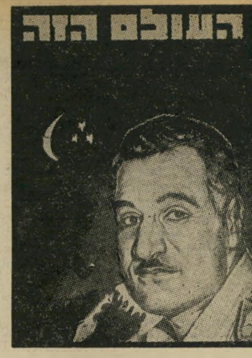
איש השנה תשמ"ז נשיא מצריים עבדאלנאצר