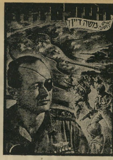
איש השנה תשי"ז מצביא סיני דיין