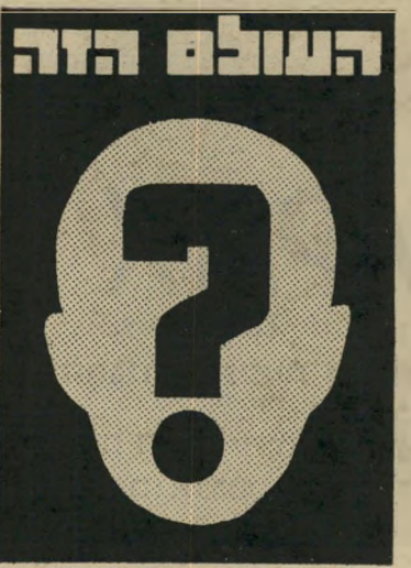
איש השנה תשל"ז