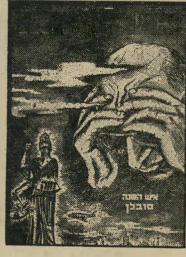
איש השנה סובלן