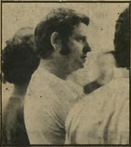
זוהר אורי זוהר, כוכב הבמה ור' המסך ומבכירי אמני ישראל. הובל על ידי דדון למי שטרט לאחר חיפוש בביתו. אך שוחרר לאחר חקירה.