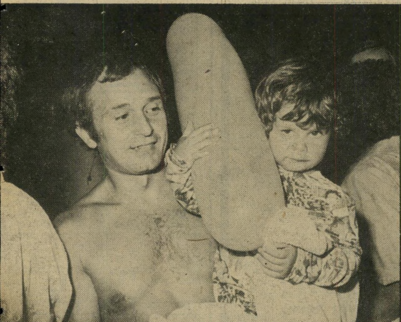
סוכריות ובלונים ילידים היתה חגיגה נהדרת, והם כמעט שלא הרגישו את הצד הבלתי־נעים של המאורע. ממתקים ובלונים דחו את בכייה הראשוני של אורחיו הקטנים של הילטון, שנאלצו לצאת מהמיטות.

בלי נעליים אך מאוטר, רוקד בכניסה ללובי של המלון אחד מניצולי הדליקה, שהספיק ללבוש על הפיג'מה שלו זוג מיכנסיים. רבים אחרים מאורחי המלון הסתפקו בלבוש צנוע יותר שנמלטו ממיטותיהם. בכמה מיקרים נאלצו אנשי החילוץ לפרוץ דלתות, ולהוציא אורחים מהמיטות.