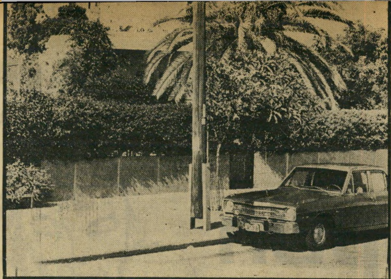
הווידה של ישעיהו האם עבד כאן הטוב ?

הפטרות והמתים . גרם התקרית שר, שאינו ידוע כאישיות מותחת ו/או