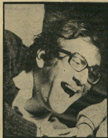
ח"כ אולמרט נגד ישעיהו

אומנם, לפי החוק היה צורך לגייס בנות אלה לשירות אלטרנטיבי, שאינו נוגד את השקפתן הדתית. השירות בבתי-החולים בוודאי אינו נוגד את דת ישראל; להיפך, הוא מיצוה דתית ואנושית כאחת. אולם ביגלל הקנוניות המסורתיות בין מיסלגת-העבודה והמיסלגות הדתיות, הנמר שכות מאז קום המדינה, אין בנות אלה מגויסות כלל. בנות דתיות בודדות אכן משרתות בבתי-החולים בנאמנות, וזכות בהוקרת החולים. אך הרוב העצום של ה-פטרות מגייס מנצל את השנים הללו ל-קידום עצמן, לבידור ולמצאיאת חתנים.