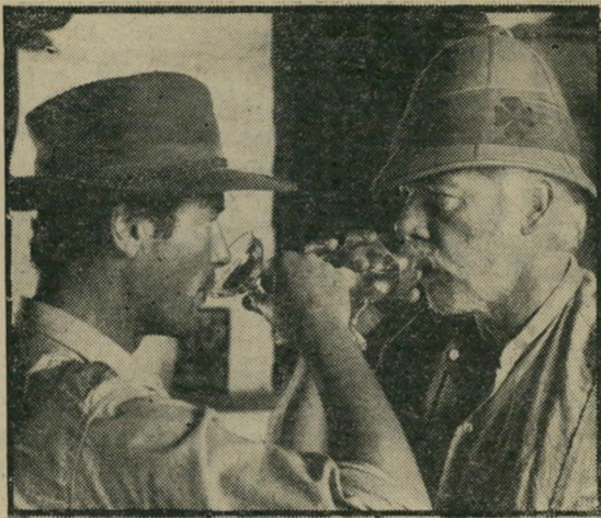
מארווין ומור: גוויות מתנדנדות

אם צד זה של הסיפור אינו נמצא בגירסה המוסרטת של מטר האנט, לפחות צריך להודות שכמעט שליש מכל ההרפתקות שבספר נכללו כאן, וזה הרבה מאד לסרט אחד. לי מארווין, שמעולם אינו מניח לבקוב לחמוק מיידו ליותר משניות ספורות, ורוג'ר מור, שכספו נגנב, מניו מוש-הרים, ביתו נשרף והוא נהרג כימעט בכל מערכה שבסרט (ויש בו מערכות רבות), מדלגים ממעשייה דמיונית אחת לשנייה, מבלי שאיש יוטרד על-ידי הסבירות ההגיונית או המשמעות החברתית של מעשיהם. הכושים, שביניהם חיים השניים (וכי איך אפשר אחרת באפריקה?) מוצגים בגישה דרוס-אפריקאית נאורה אופיינית, כבשר-תוחחים או כשקר-רגים מושבעים או, במיקרה הטוב, כשרתים נהאמנים. הגר-מנים הם או חזירים מפותמים ומגעילים, או קצינים מסור-ידיים מרוב תקנונים שרובצים על מצמונם. האנגלים כימעט שאינם קיימים (לפי הכותרות, היו כנראה יותר, אבל סרט זה, שעבר הרפתקות רבות בהפקתו ותקציבו האמירי לפי-שלושה יותר מן המתוכנן, נמשך זמן רב מדי לדעת המפי-