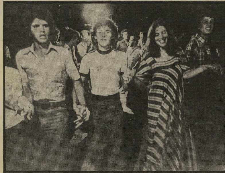
צעירים יהודים וערבים רוקדים בסכנין דרך להביע הזדהות

עשרות הצעירים, רובם סטודנטים ותלמידי תיכון, באו לכפרים הערביים סכנין, עראבה ודיריחנא, לשבוע של "הבעת סולידריות עם המאבק הערבי-ישראלי נגד הפקעת האדמות בגליל". למשך השבוע חולקו הצעירים בין בתי ערבים, תושבי הכפרים, ועיקר עיסוקם