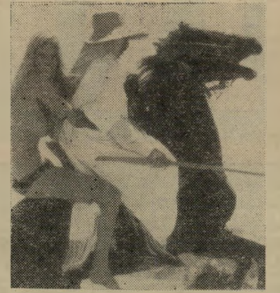
ברדואי אבינו, פוסו וידידה.

מיד אחרי שהקים את מאהלו לא רחוק מכביש באר-שבע — דימונה, התחילו להתעצבן מן העניין כל המובילי ציסטים ועיתונאי-התחקיר של האמורי, החיו, הפריזי והיבוסים, הביאו סטטיסטיקות ומחקרים ואמרו שזאת התנחלות בלתי-חוקית ובנה בלי רשיון ושעוריה