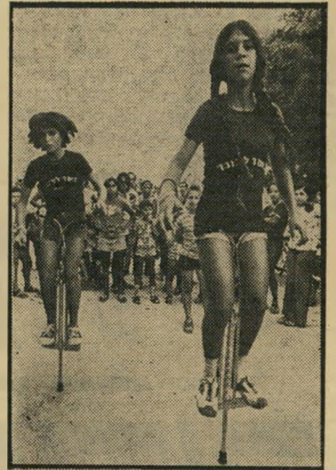
נערות על פוגה שיגעון מישפחתי -

מי שלא חזו לפני שבועיים בשידורי הטלוויזיה מאולימפיאדת מונטריאול הוא גם במקרה תושב הרצליה, יכול היה להיחזק באליפות ישראל מיוחדת במינה - אליפות ישראל בקפיצה על פוגה. מה זה פוגה? העוברים והשבים ברחובות הרצליה לא הבינו בתחילה במה מדובר. נערים ונערות בבגדי ספורט קיפצו ברחובה הראשי של העיר על מכשיר