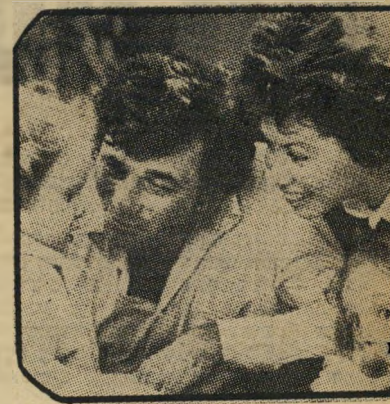
פוק ומישפחתו יחסים ידידותיים

פיטר, המשתכר כ-300 אלף דולר עבור פרק של קולומבו, יעשה רק אחד כזה בשנה. כדי לאפשר לעצמו קצת יותר זמן בסרטים המעניינים אותו, כמו, למשל, רצח על-ידי הריגה, אחד מלהיטי הקיץ, שבו מגלם פיטר בלש נוסח האמפרי בוג-ארט - או, מה שחשוב הרבה יותר, ביצון