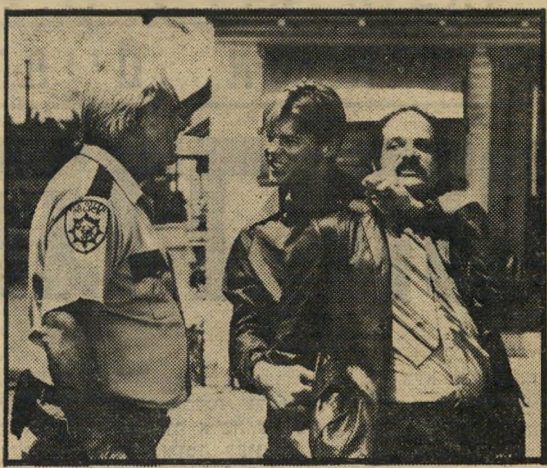
ז'אן וינסנט (במרכז), העתק של גיבור

כל זה נראה כמו גירסה זולה ופשטנית של בראש מורם, מבושל בדייסת מיסאלת מוות. ואם לזכור שגם שני המוצרים המקוריים לא היו מן המוחכמים ביותר, הרי קשה למצוא משהו לומר בזכות הסרט הזה. עיקר הפעולה בו, עד לרבע השעה האחרונה, מתבטא בניפוץ כסות ושולחנות של מיסבאות מדומות, והבימוי מבולבל למדי כיוז שאי-אפשר יהיה להבחין מי בעצם נלחם בעד ונגד מי, ולמה. המצב הופך קריטי עוד יותר בסצנת-העימות האחרונה בין כנופיית