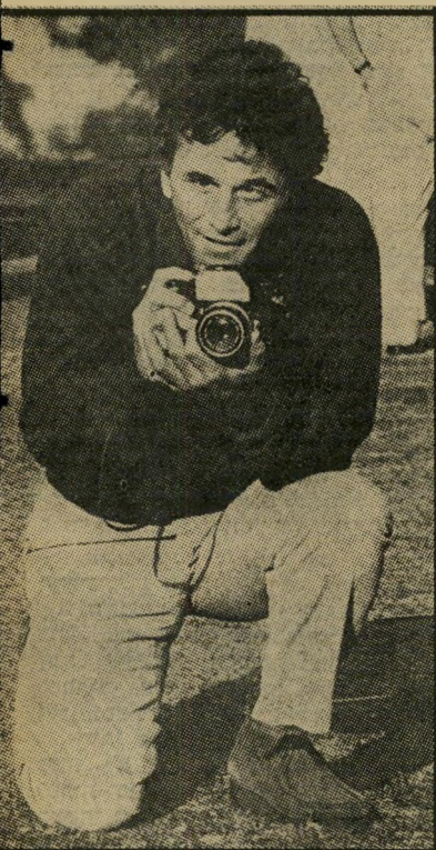
שחקן פיטר פוק אחרי 16 שנים