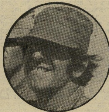
טופור / חכיר