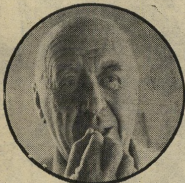
פרמינגר / אשלי 1

ב יום הרביעי, ה-14 ביולי, התקיי- מה במישרד ראשהממשלה בירוש- לים אחת הישיבות הסודיות, שנערכו בעיקבות מיבצע אנטבה, שאירע ארבעה ימים קודם לכן. בישיבה, שהחלה בשעה 9 בערב, ושר הסתיימה שעתים אחר-כך, השתתפו ארי בעת השרים הבכירים בממשלה ויועציהם. ראשהממשלה יצחק רבין נעזר בשירי- תיהם של יועצו למילחמה בטורו, האלוף (מיל), רחבעם „גנדי“ זאבי; יועצו לי- ענייני עיתונות, דן פתיר; וראש ליש-