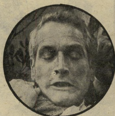
ניומן / את