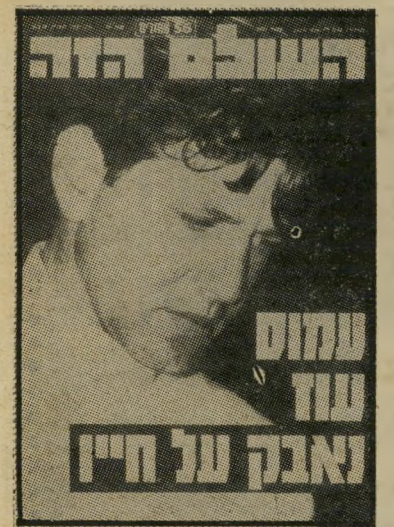
"העולם הזה", 20.7.76 זכות הציבור לדעת

מה עוד שברוב המקרים זהו אינטרס של הנפגע עצמו שהמידע על מצבו יגיע לידיעת הציבור הרחב. יש אומנם דרגות שונות להכרה זו בזכות הציבור לדעת. במדינת ישראל קשה לצפות שראש-הממשלה או אחד השרים, שהחלים מניתוח מעיי-עיוור, יציג לראווה בפני צלמיי-עיתונות את הצלקת שנתורה על ביטנו — כשם שעשה בזמנו נשיא ארצות-הברית לינדון ג'ונסון. אבל אפשר לצפות גם שרופאיה של אישיות בכירה ימסרו דו"ח לציבור על מצבה כשהיא