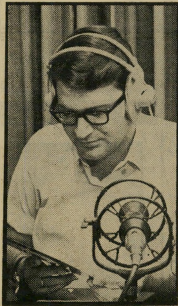
מגיש פאר הצליל של הקול

מנועי מכונות, מזגני-אוויר; הם ראו טלוויזיות, מערכות סטריאו-אופון ניות ושאר אביזרי-השמק יקרים. לא צריך להיות נושא תפקיד בכיר בטלוויזיה כדי לדעת, שכאן אחד מן פריטים אלה מחירו הרבה יותר ממה לירות.