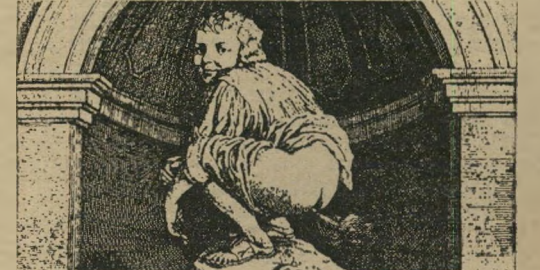
כתבנו מדווח ערכנית מוירת החירכון

נית מאד פופולארית, שקוראים לה „שירים ושערים". המון כתבים יושבים בשבת בכל מיגרשי-הכדורגל, ומדווחים על כל וולה, פאול, פנדל, קרן, גול, בננה, פילפל ומלמי-ליאו.