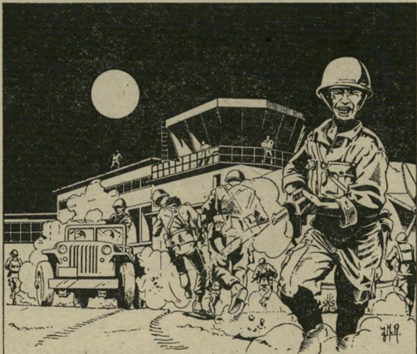
Les paras font sauter la tour de contrôle et onze Mig ougandais, tuent 100 soldats d'Amin. Quatre des 104 otages trouveront la mort. Seule victime chez les assaillants : un officier frappé d'une balle dans le dos.