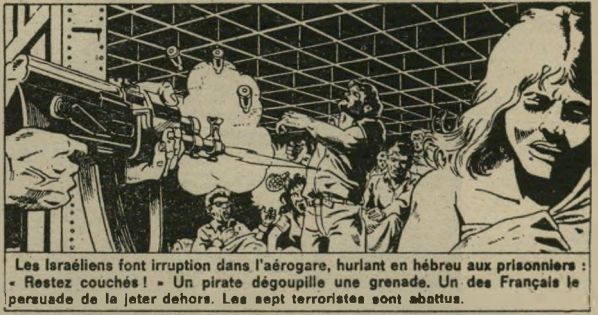
Les Israéliens font irruption dans l'aérogare, hurlant en hébreu aux prisonniers : - Restez couchés ! - Un pirate dégoupille une grenade. Un des Français le persuadé de le jeter dehors. Les sept terroristes sont abattus.