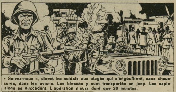
- Suivez-nous - disent les soldats aux otages qui s'engouffrent, sans chaussures, dans les avions. Les blessés y sont transportés en jeep. Les explosions se succèdent. L'opération n'aura duré que 26 minutes.