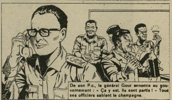
De son P.c., le général Gour annonce au gouvernement : - Ça y est, ils sont partis ! - Tous ses officiers sablent le champagne.

הרקולס כשהם נושאים 85 צנחנים. 20 נוספים מגיעים על גבי ג'יפים מקניה. הישראליים מתפרצים אל הטרמינל (באמצע מימין), פוגעים בטרוריסט המנסה להטיל רימון. הצנחנים השמידים 11 מטוסי מיג ומאה חייליים אוגנדיים (באמצע משמאל). על רקע שדה-התעופה הבורע מובלים המשוזררים למטוסים כשהפצועים נישאים על גבי ג'יפים. הפעולה נמשכה 26 דקות. הרקולס נוחת בניירובי (למטה משמאל). הפצועים מועברים לניתוח במטוס שהוכשר לכך. דן שומרון (בדמותו של מוטה גור) אומר: "ההחלטה על ההתקפה היתה קשה יותר מהביצוע". במטהו (למטה מימין) מודיע מוטה גור (הנראה כמו ראש אמ"ן מרדכי גזית) לממשלה: "הם המריאו". הקצינים שלו שותים שמפאניה. גם בעתונים אחרים ברחבי העולם פורסמו ציורים דומים.