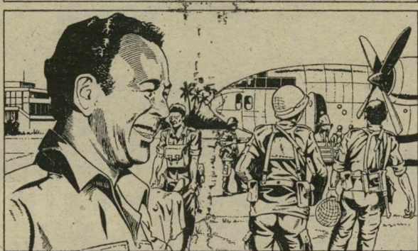
A Nairobi, les Hercules font le plein. Les blessés sont opérés dans un avion antenne chirurgicale. Dan Shomron, commandant en chef des paras, exulte : - La décision de l'attaque a été plus difficile que l'exécution.