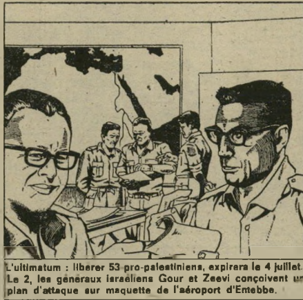
L'ultimatum : libérer 53 pro-palestiniens, expirera le 4 juillet. Le 2, les généraux Israéliens Gour et Zeevi conçoivent un plan d'attaque sur maquette de l'aéroport d'Entebbe.