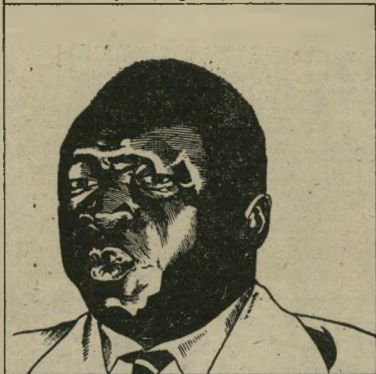
Depuis le 28 juin, le président Amin Dada - négociateur - au nom des pirates de l'air qui ont détourné l'Airbus à Kampala (Ouganda).

תמונה זו, בה נראה הפילדמרשל אידי אמין, לבוש בחליפה אזרחית ומיגבעת לבנה, מבקר אצל חטופי מטוס אייר-פראנס באנטבה בימים הראשונים שלאחר החטיפה, פורסמה בעיתוני העולם רק אחרי פשיטת צה"ל ושיחרור החטופים. נראה כי האוגנדים, שצילמו את התמונה, דאגו להפיצה כדי להעיד על יחסו הטוביכביכול של אידי אמין לחטופים.