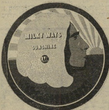
ועד תקליט קולומבוס - ויש לו זקן -

תמש בדיוקני, אבל לעשות את זה כך שזה ייראה פרצוף סתמי. בצרפת וביפאן משתגעים לדעת מי האיש המזמר, ושל מי הפרצוף המופיע על עטיפות התקליטים.