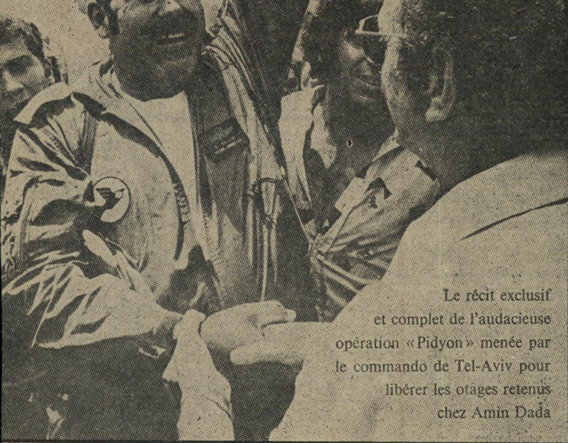
Le récit exclusif et complet de l'audacieuse opération «Pidyon» menée par le commando de Tel-Aviv pour libérer les otages retenus chez Amin Dada

ant y de la foule qui pousse le do Libérateur et le pilote en cargo à la fois remplis sur de Kampala.