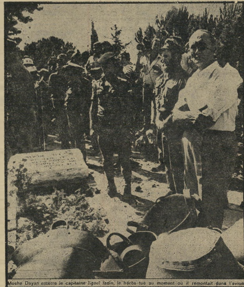
Moshe Dayan enterre le capitaine Igael Yadin, le héros tué au moment où il remontait dans l'avion

כתב המו"ל: „איך ייתכן שזה יהיה בעתונכם ביום שני בבוקר כשהיה רק בשבת בלילה ז' — השאלה המתעוררת בכל פעם כשסיפור מאחר-התרחשות מופיע על דפי הטייס, התעוררה שוב בשבוע האחרון כש-98.5% מקוראינו קיבלו את עותקי השבועון עם הכתבה עשינו את