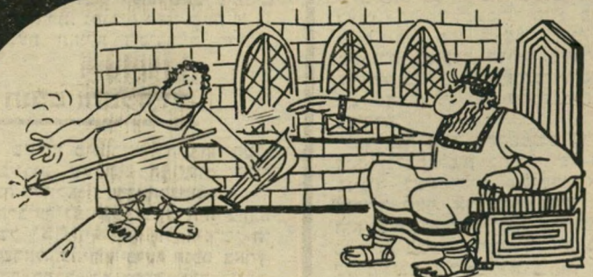
„ויך את החנית בקיר.“ (שמואל י"ח 10)