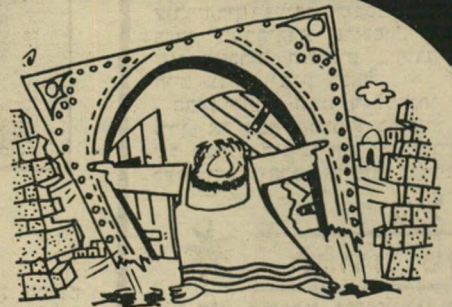
הנפה „ויאחזו בדלתות שער העיר ובשתי המזוזות ויסעם עם הבריה וישם על כתפיו.“ (שופ' ט"ז 3)