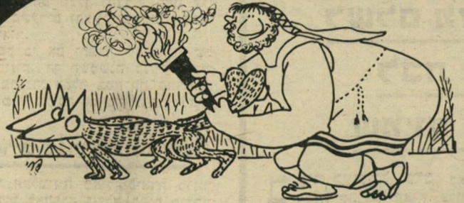
„ויילכד שלוש מאות שועלים ויקח למיזים ויפן זנב אל זנב וישם למיד אחד בין שני חזנות בתווד ויבער אש בלמיזים וישלח בקמות פלשתים.“ (שופ"ט 5)