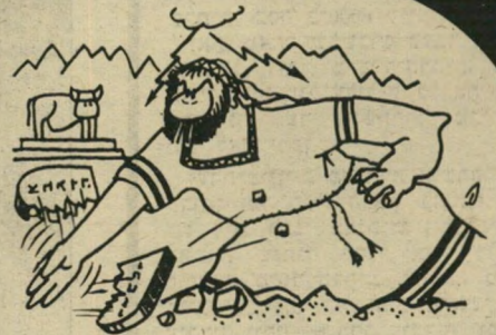
„וישלך מידו את הלוחות וישבר אותם תחת ההר.“ (שמות ל"ב 19)