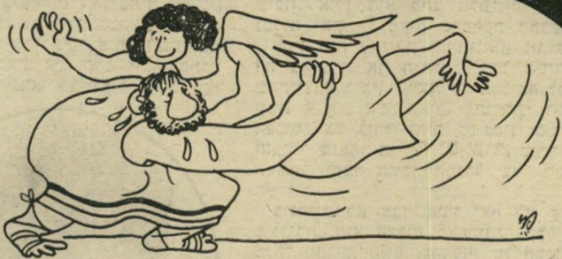
„ויאבק איש עמו עד עלות שחר, וירא כי לא יכל לו ויגש בכף ירכו ותקע כף-ירך יעקב בהאבקו עמו.“ (בראשית ל"ב 25)