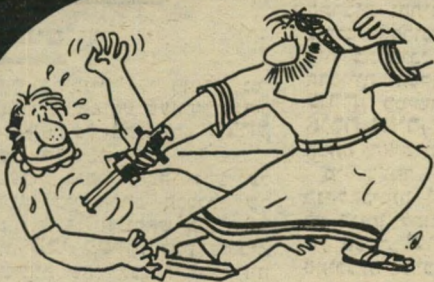
„ויקח את החרב מעל ירך ימינו ויתקעה בבטנו.“ (שופט' ג 2)