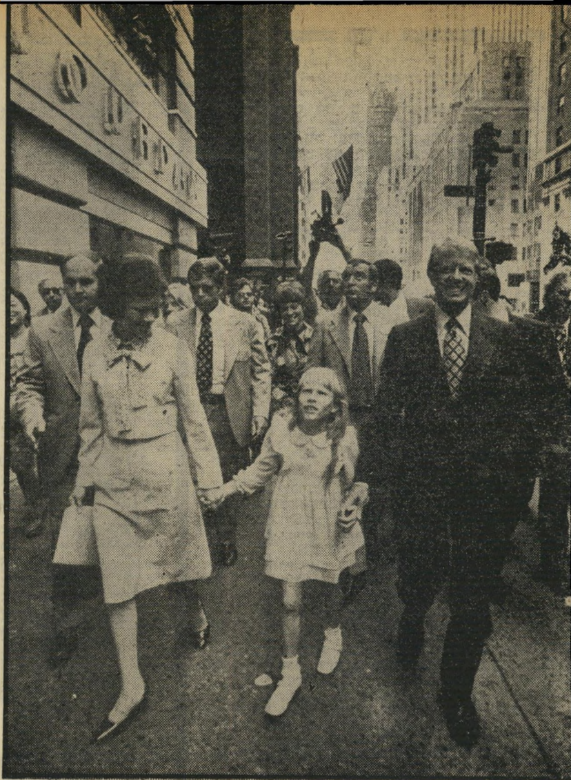
מועמד קארטר (עם אשתו רוזלין ובתו אימי) הוא לא יהיה בוס קל