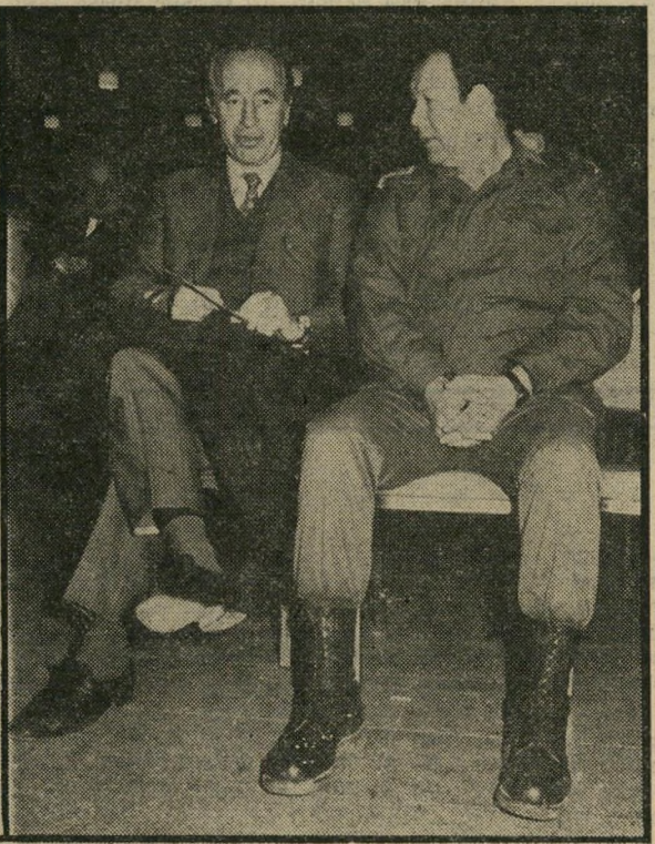
הרמטכ"ל, שר-הביטחון ודובר צה"ל מי נתן את ההוראה?