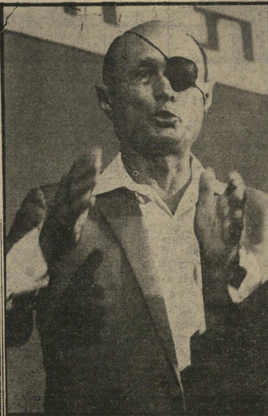
שר-ביטחון-לשעבר דיין התרברבות