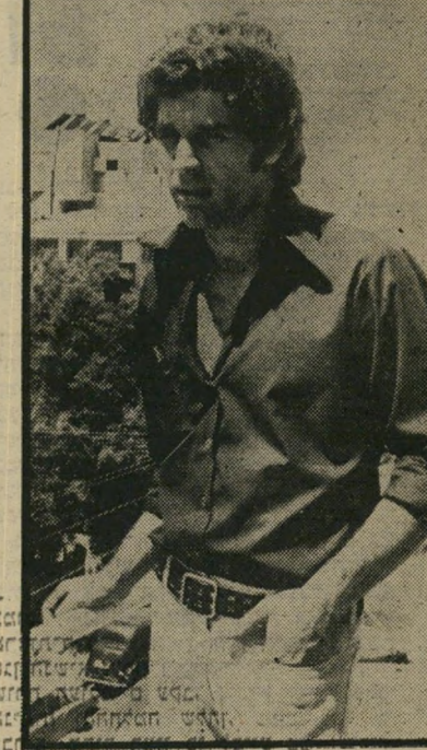
החברת... היא חיה בעושר רב... השתתפה בכל קבלות-הפנים החשובות במדינה, ואירחה בבתים המפואר את כל אלי-התהו הרציניים, כולל אילי-אורחים מחו"ל.

בתור אשתו של התעשיין המצלח, היא חיה בעושר רב. השתתפה בכל קבלות-הפנים החשובות במדינה, ואירחה בבתים המפואר את כל אלי-התהו הרציניים, כולל אילי-אורחים מחו"ל. היא נהנתה מהחיים היפים בחוג הסילון. רק דבר אחד היה חסר לה — רישון-נהיגה. בעלה הדאג והאוהב לא התעצל גם הפעם למלא את כל נכסיה הנחמדי-לה מכונית מפוארת בתוספת נהג צעיר ואדיב. הנהג הצעיר השתדל כליכך למלא אחר דרישות מעבידתו שהוא היה מוכן להתמסר אפילו למשנהו, כשהתברר לו שהיא חוגגת אגרו. ככה הם המשיכו לנהל את פרשת-האהבים שלהם על גלגלים, עד שהתעורר חשדו של הבעל, שגם הפעם לא התעצל, שכר בלש פרטני ונה מסר לידיו את כל ההוכחות שאימתו את חשדו. האשה נאלצה לעזוב את הבית, וחיה עם נכסיה במחנה-המנוחה לא הפזיטים שהיא כליכך התדרה בהם וללא שום פינוקים. אומנם, לחברותיה היא מספרת שהיא מאוהבת, אבל בינו לבין עצמן הן שואלות כמה זמן היא תוכל לתמוך כל חיות מאתה. אולי שעור-הזהב המשובץ יהלומים שבעלת הבית לא בשמנו במתנה מבדיסל, יזכיר לה לטובת מי פועל הזמן.