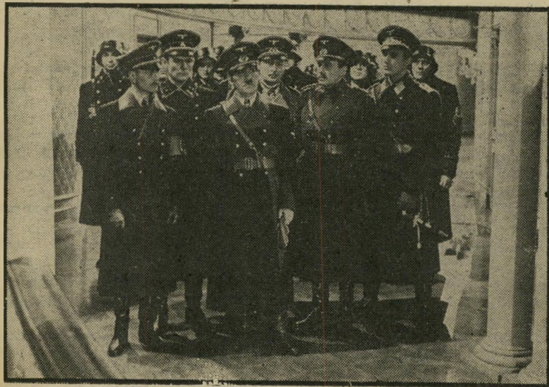
היטלר המרומה ופמלייתו — אנחנו עושים לפולין!

היטלר: יחי אני! לוביטש עצמו נתן דוגמה אחרת, שאותה לא הכניס לסרט. "תארו לכם קבצן בפנית-הרחוב. עובר אורח מטיל מטבע-זהב לכובעו. הוא רץ לצורך לפדותו, והצורך מגלה שהמטבע מזויף. הקבצן מאוכזב, אבל מתנחם בכך הזהב. הוא פונה ליציאנית בפניה ממול,