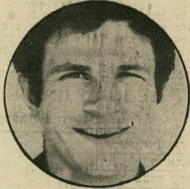
יונאי פרחים על קיברו

● תודת פולנו נתונה ללוחמים, שביצעו את הפעולה הנועזת באנטבה. ברור חי, אני מנח מרחם על קיברו של יוני, ומביע את הערכתי העמוקה לחבריו. ● אני סבור כי ההחלטה לבצע את הפעולה, בתנאים המסויימים שהיו, היתה מוצדקת. ● אני רוצה להעלות על נס את כושר-ההחלטה של יצחק רבין, שנתגלה מחדש בפרשה זו. הייתי איש-הציבור הי ראשון במדינה שהציע את יצחק רבין כראש-הממשלה, עוד בשנת 1969, ואני רואה בו גם כיום אדם המסוגל להחליט החלטות שוטפות בצורה רציונלית, שקו-לה ואחראית. ● לעומת זאת, יש לי ביקורת קשה מאד על יצחק רבין כמנהיג המסוגל להציע ולבצע פיתרונות לטווח ארוך לבע-יות-היסוד של המדינה. ממשלה אינה מופקדה של אירגון-קומנדו, ובסופו של דבר יש לבחון אותה על-פי כושרו לפ-תור את בעיות-היסוד של המדינה, בעיות-פנים ובעיות-חוץ כאחת. ● הדבר רלוונטי גם לבעיית הטרור: מזה שנים רבות אני חוזר על המשל-הפשוט הזה: הטרור דומה להקת תור-ים, ואילו הביצה היא הבעיה הפלס-