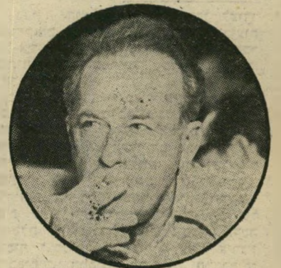
יצחק רבין הביצה לא יבשה

זו. אם נשמע לעצת אחיתופל וננהיג עו-נשימוות, יביא הדבר לרציחות הדדיות ללא אבחנה, בכל רחבי העולם. ● פעולת אנטבה, שזקפה את קומתם של רבים, ושהעלתה את המוראל למי שהיה זקוק לכך, צריכה לנטוע בנו מה-דש את הביטחון בכך שאנחנו מסוגלים לפתור בעיות קשות, מתוך ביטחון עצמי והרגשה של כוח. הבעייה העיקרית שיש לפתור אותה היא הבעייה הפלסטינית. ● ובמישור המעשי: חבל שיצחק רבין לא ניצל את התחזקות הממשלה כדי לשים קץ לפרשה האומללה של קדום ולבעיות מטרידות אחרות שנשארו ללא-תשובה בתקופת חוסר-האונים של הממ-שלה.