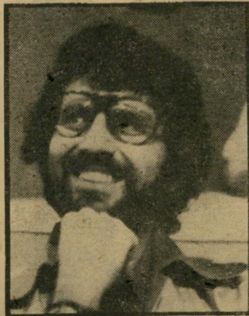
סמיה אר-קאפם השמטה וטילוף

דומים על משרורים וסופרים קומוניסטים ומתקדמים ערביים.