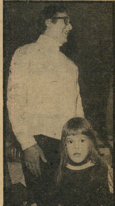
ח"כ אולמרט וכתו טיול הפחד

האידייליה שאיפיינה את פעילותו הבלתי-מעוררת של המימסד היהודי בארצות-הברית החלה מתערערת. הופעתו של קבר צות גדול והולכות של משכילים יהודיים (ברירה, בניו-יורק; יוזמה בלוס-אנג'לס; חוצפה בשיקאגו; הפרוייקט המזרח-תיכוני בסן-פרנציסקו; צדק צדק, בושינגטון) קבוצה אחת של נוער ציוני יהודי ושל קבוצות יהודיות-נוצריות של נשים, סטודנטים, אנשי-מדע, רבנים רפורמיים וקונסרבטיביים — כל אלה הביאו איתן דאגה גוברת והולכת אל המישרדים הבלתי-מאווררים של עשרות האירגונים, הוועדים, ה מועצות והתנועות היהודיות המסורתיות, שגיל מנהיגיהם עולה בהתמדה, ביחס ישר לירידת מיספר חבריהן הפעילים מן השורה. עם הופעת-ההכחשה של האירגון החשוב ביותר, ברירה, גילה התדרוך של השגרירות הישראלית בושינגטון, והקונסוליות המ פוזרות ברחבי ארצות-הברית, כי "קבוצת ברירה ממומנת בסכפי אש"ף והי לובי של חברות-הנפט..." מסביר המימסד הציוני והישראלי הוסיפו להסבירו כי מהות השם ברירה היא "ישנה ברירה אחרת למדינת ישראל: מזינה דמוקרטית, כפי שמציע אירגון פתח..."