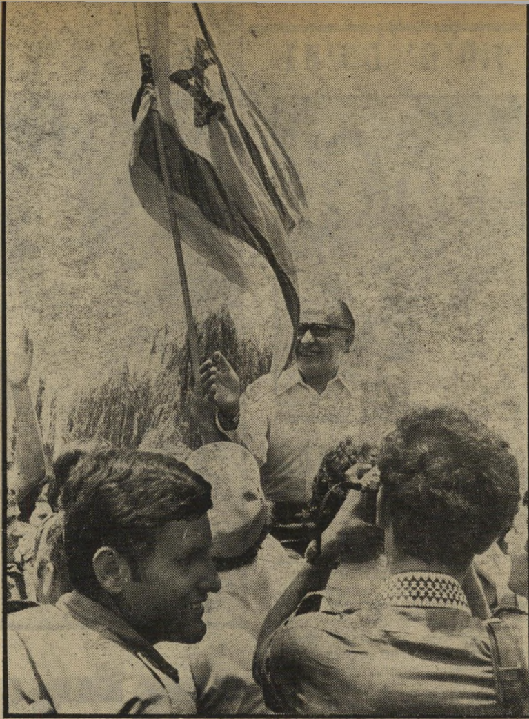
ח"כ בגין על כיתפי מעריצים בשדה-התעופה העסקן זכה בתהילה לא לו

כל עם אחר היה מגיב באותה שימחה, אולם שימחה בריאה זו הפכה במהרה אורגיה היסטורית. המחזה הפרוע והמביש בשדה-התעופה, בעת קבלת החוזרים (ראה עמודים 22-23), גרע מן המיבצע המרשמי, גם בעיני העולם שצפה בו מעל