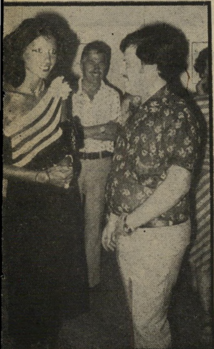
ציור נמיר ומעריצה * הוא היה המוס

תערוכה, מצא כי ציורי חיילים פצועים שותתים, קברים של חיילים אלמורניים, גוויות מרוטשות וטנקים שרופים אינם בדיוק מה שהישראלי המצוי רוכש היום כדי לתלות בסלון שלו. הוא גנז את כל ציורי-השמן הצבאיים שלו, וחזר ל"אהבתו הישנה: רישומי נשים בעירום פיר גוראטיבי עדין.