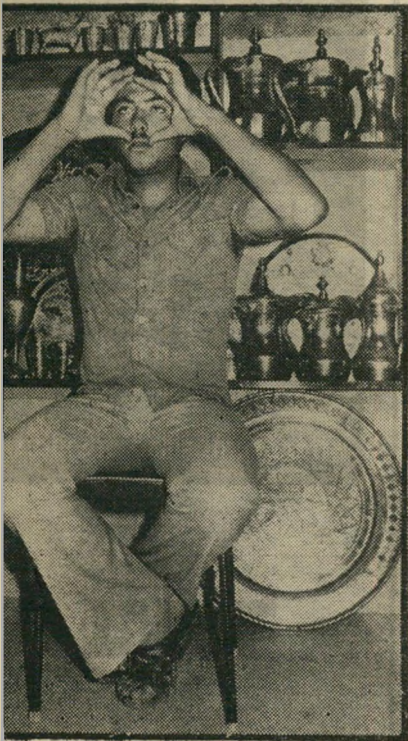
„ניסו עיני בנד שחור...“

אנשיו. שני החוקרים, הסמל ורבישוטר, החלו שוב מפעילים אגרופיהם ואת רגליהם, ובעטו בנאדף שעלה על המדרגות בתחנת-המישטרה, כשהם רודפים אחריו. כשהגיעו לקצה המדרגות, תפסו השוטרים את העצור ומשליכו אותו למטה. על המדרגות, כשחאו מתגלגל ממדרגת למדי-