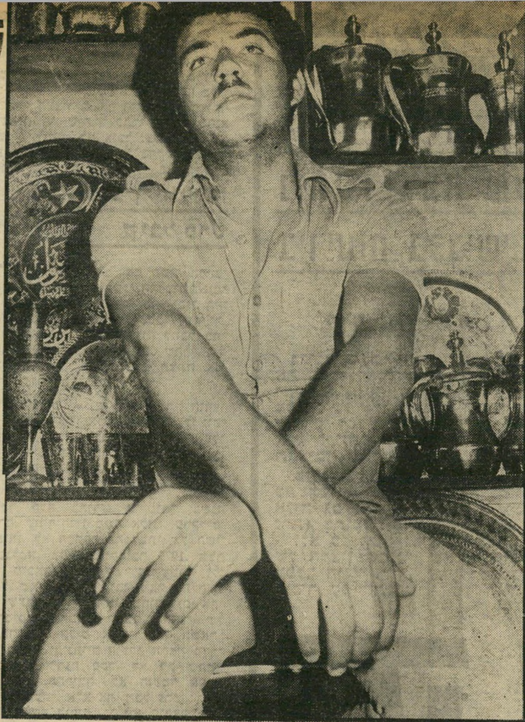
„כבלו את ידיו, הכניסו אותו לניידת והיכו אותו...“