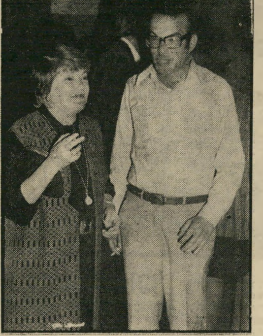
יוסי שריד (עם ג'טה לוקה)

השגון הזה את דעתו על יצחק רבין וייגאל אלון. לפיו, שניהם מתאימים בקושי לניהול המועצה המקומית של עקרון.