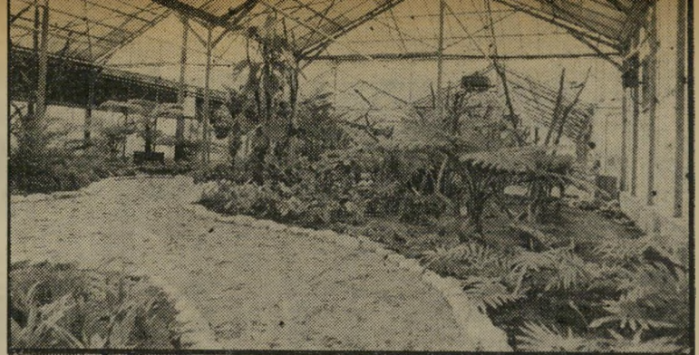
הגן הבוטאני באברי-כביר העיר התחיבה לספר

זכרונות של צדק הוא סרט המחולק לשניים. חציו הראשון נושא את כותרת המישינה גירונברג והגרמנים, החצי השני - גירונברג והאחרים. כל זאת, מתוך ההנחה שהתופעה הנאצית שבאה לידי ביטוייה המתומצת במישפטי גירונברג, אינה מהי וזה חריג בהיסטוריה, אלא היא חלק בלתי-תיישרד ממנה, ומשום כן צריך ללמוד