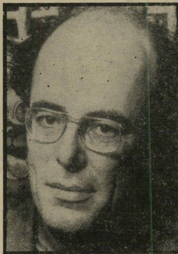
במאי מרסל אופולס חינוך אנטי-ציוני

החוק הגזעני, שפילוד לעדויות אלה, עדויות מן החדר: תלפזר טיילור, התובע האמריקני, הורד: הארטלי שאקרוס, התו-