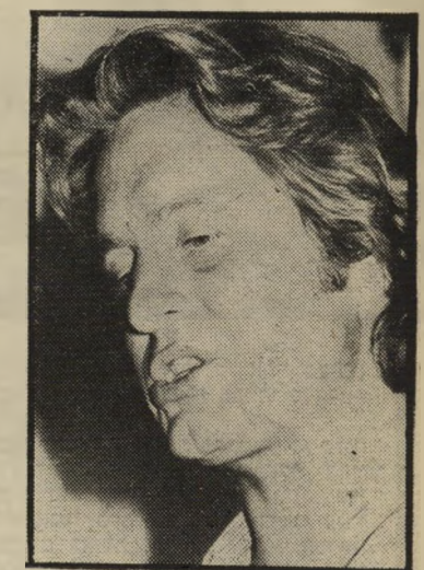
מפיק דוגלאס אוסקר לא רק על מישחק

יש משהו מעורר בעובדה שהמפיק האמריקאי המצליח של היום אינו גראה עוד כדמות הלקוחה מתוך ספריו של הרולד רובינס. אין זה עוד היהודי השמן והמקריח שסיגר ניצחי נעוץ לו בין שיניו. המפיקים האמריקאיים של שנת 1976 שונים בתכלית מאלה של שנות החמישים והשישים. הם אומנם עדיין יהודיים, אך בהחלט לא גוצים שמנים ומקריחים. שניים מן המצליחים שבהם נמצאים עתה בביקור בישראל: מייקל דוגלאס ומייקל פיליפס בני ה-32.