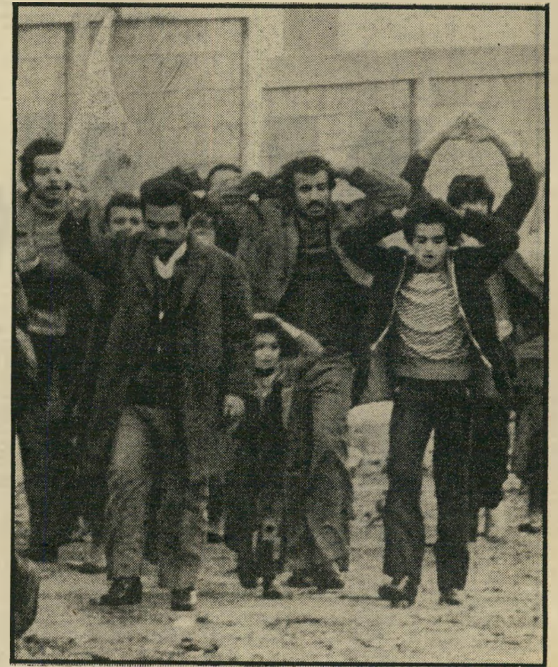
מוסלמים נכנעים לפאלאנגות כביירות היכן הקו האדום?

מ כל המישחקים האלה, המישחק הישראלי נראה קצר-רואי ביותר — קצר-רואי עד כדי איוולת. אימרה עתיקה אומרת: "האויב של אויבי הוא ירידי!" אבל זוהי אמת עדי-תנאי. וכך להיות שהאויב של אויבי מסוכן יותר מאויבי עצמו — ואז דווקא אויבי צריך להפוך ירידי. המדיניות הנוכחית של ממשלת ישראל — אם אינה בבחינת כגיעה פשוטה לתכתיב אמריקאי — מבוססת על ההנחה כי אש"ף הוא האויב העיקרי של ישראל. מי שלוחם באש"ף הינו, על כן, בעל-ברית-בפועל, ויש לשתף עימו פעולה. אולם בין סוריה לישראל אין ברית. שום הסדר ישראלי-סורי, הפותר את הבעיות היסודיות, אינו נראה אף באופק. ישראל לא הציעה לסוריה את החזרת רמת-הגולן — דבר שבילעדי אין אף לחלום על רגיעה בין שתי המדינות. להיפך, ממשלת רבין ממשיכה להתנחל ברמה — ביוזמה שכל התנחלות היא פרובוקציה נוספת כלפי סוריה, הרואה ברמה חלק מן המולדת הסורית הקדושה, פרבר של דמשק.