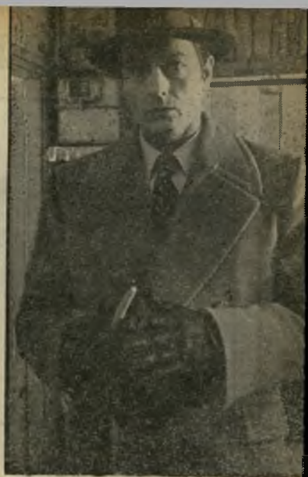
אזן דרון כ"מר קליין" זקני ציון כלייכולים

שהוא היום. ושלישית, הצימאון לסרטים בכמה משוקי העולם (הן משום שכל סרט מוצג פחות זמן, ומשום כך צריך יותר פרטים, והן משום שבתקופות משבר כלכלי הצפייה בקולנוע תמיד בעליה). קאן הפכה היריד הקולנועי הגדול ביותר של השנה. אשר לרמה היורדת של הסרטים, כאן יש בוודאי מקום לניתוחים ארוכים ומסורכיים. ראשית, אותו צימאון למוצרים גורם לעבודה חפוזה יותר, שנית, צמיחת כוכי