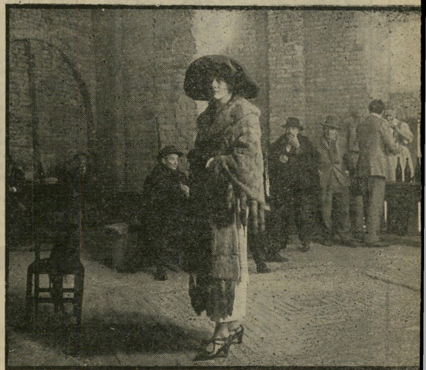
דומיניק פאנדה כפירטו של ברנרדו ברטולצ'י: "1900" מיפלצת חדשה לטטאלין