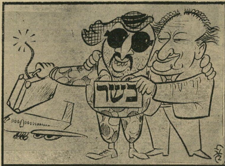
הקאריקטורה של זאב