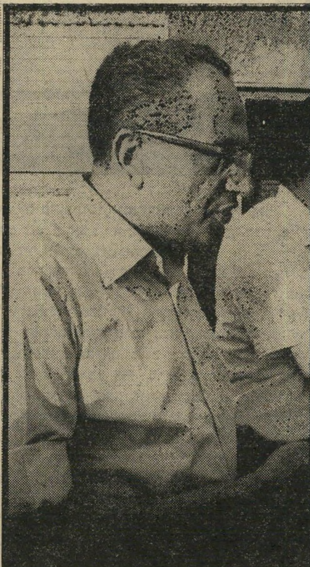
ח"כ כני-פורת יידחה