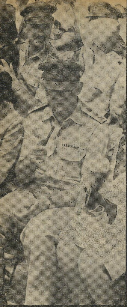
רב אדוף (מיר) לסקוב מצטרף