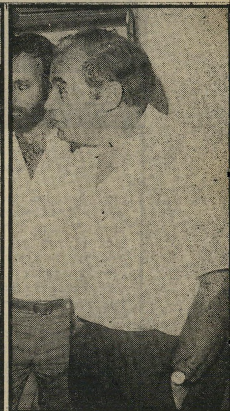
ח"כ תמיר יידחה