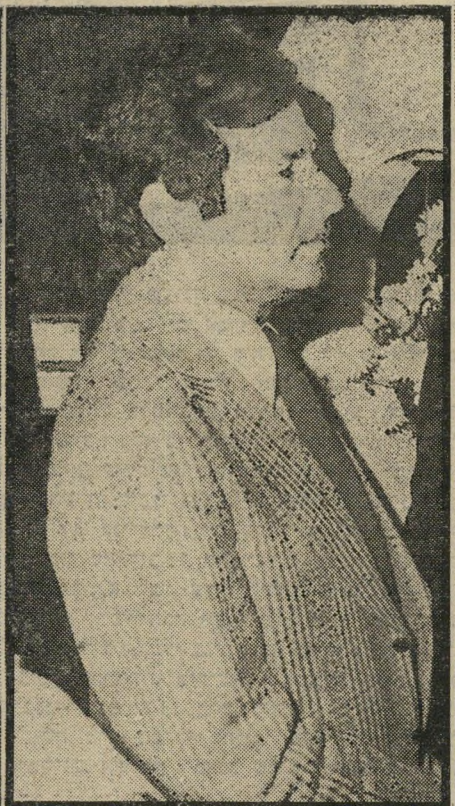
פרופסור רובינשטיין יידחה