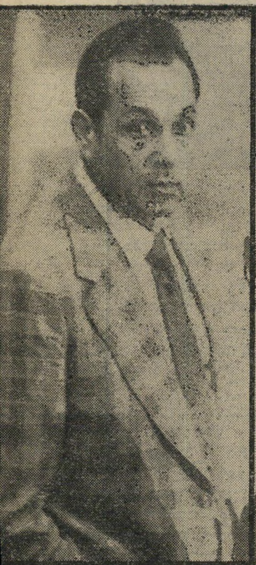
ח"כ מודעי נשוג