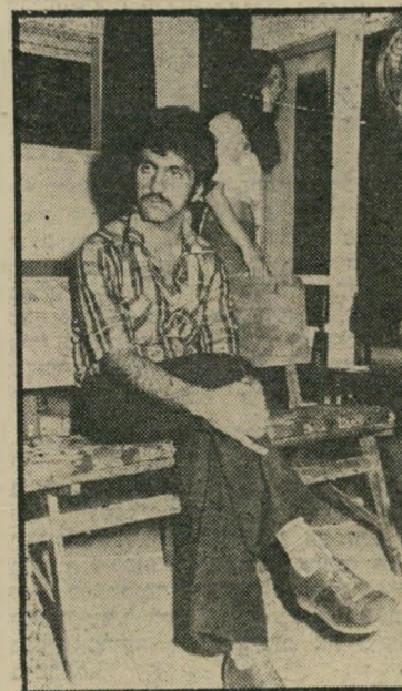
תלמיד רזו אבנחה פסיכולוגית

בהולנד ובאוניברסיטאות אהיו וקליפורניה בארה"ב. אבל רוב הפונים אלי לא היו מוכנים לנסוע לחו"ל למטרה זו, ולחצו עלי שאקים מרכז ללימודי האסטרונוגיה כאן, בארץ.