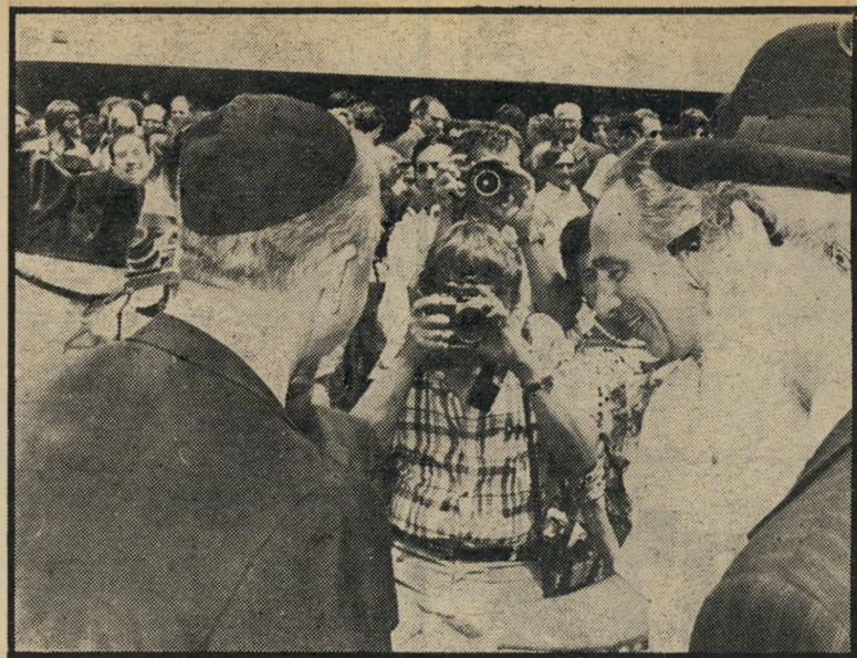
ההתייחסות הסצינה שגנבה את ההצגה מטכסי הקידושין: שר הביטחון שמעון פרס מושיט את ידו לעבר יצחק רבין בחיוך של התפייסות, אחרי שיום קודם לכן נפגשו השניים לשיחת הבהרה ופיוס רישמית.