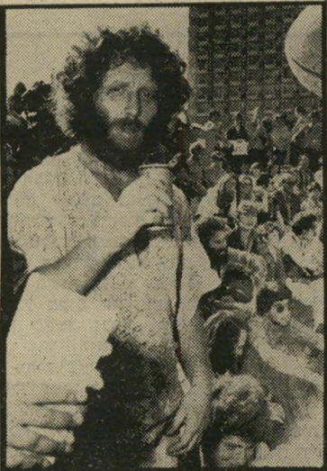
שחקן רובין (בביכר אתרים) "הוא רצה להשתלט!"