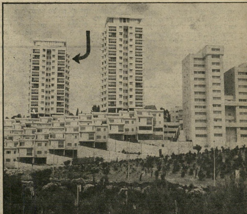
הדירה שקיבל פלד מוולפסון - והווילה שבנה וולפסון בעזרת הפטור