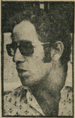
מכר את המיגרש למי שהיה סגן נציג אגף ההכנסה