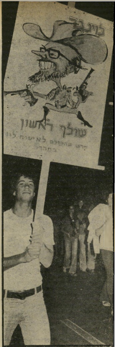
מפגין בהפגנת מפ"ם

פשיטת רגל. כל זה לא הועיל, הבר חרים פשוט לא נשמעו לבוסים המיפלגתי-תיים, והפועלים לא צייתו לעסקני האגוד המיקצועי. רק היהודים נשארו נאמנים לג'קסון — וכך נתברר כי הקול היהודי אינו שווה הרבה, גם במדינה „יהודית“