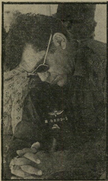
דוד אלעזר ז"ל איך נפלו גיבורים

מה גאה הוא העם — שאלה הם בניו / לא ידעת אימה, לא נוצחת בקרב / זרבות לא הכריעו, איתן ניצבת כל הדרך. / וכך, בעומדנו שטופי דמע ונהי / מעל קיבוץ הטרי, / עולה דמותך בסערה — אתה עימנו תמיד. על כתפיד נשאת בעול האומה / אומה שלא ידעה לסלוח / אשר הוקיעה אותך בבוא היום ומיאנה למחול. / בודד הו' תירון בשדה-הקרב, וכולם נסו מאחירותם