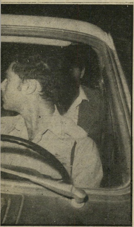
3. בדרך יוצאים ממשרד

אבי הילד החטוף טוען עתה שאנשי המישטרה עזרו לאשתו להסחיד את הילד